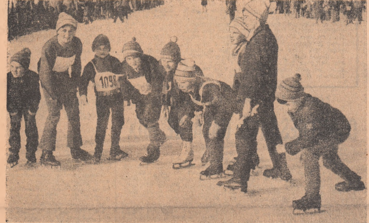
„Cupa tineretului” strânge ambii sportivi, cum se vede și în această imagine care-i reprezintă pe tinerii patinatori gata să se arunce pe gheață...