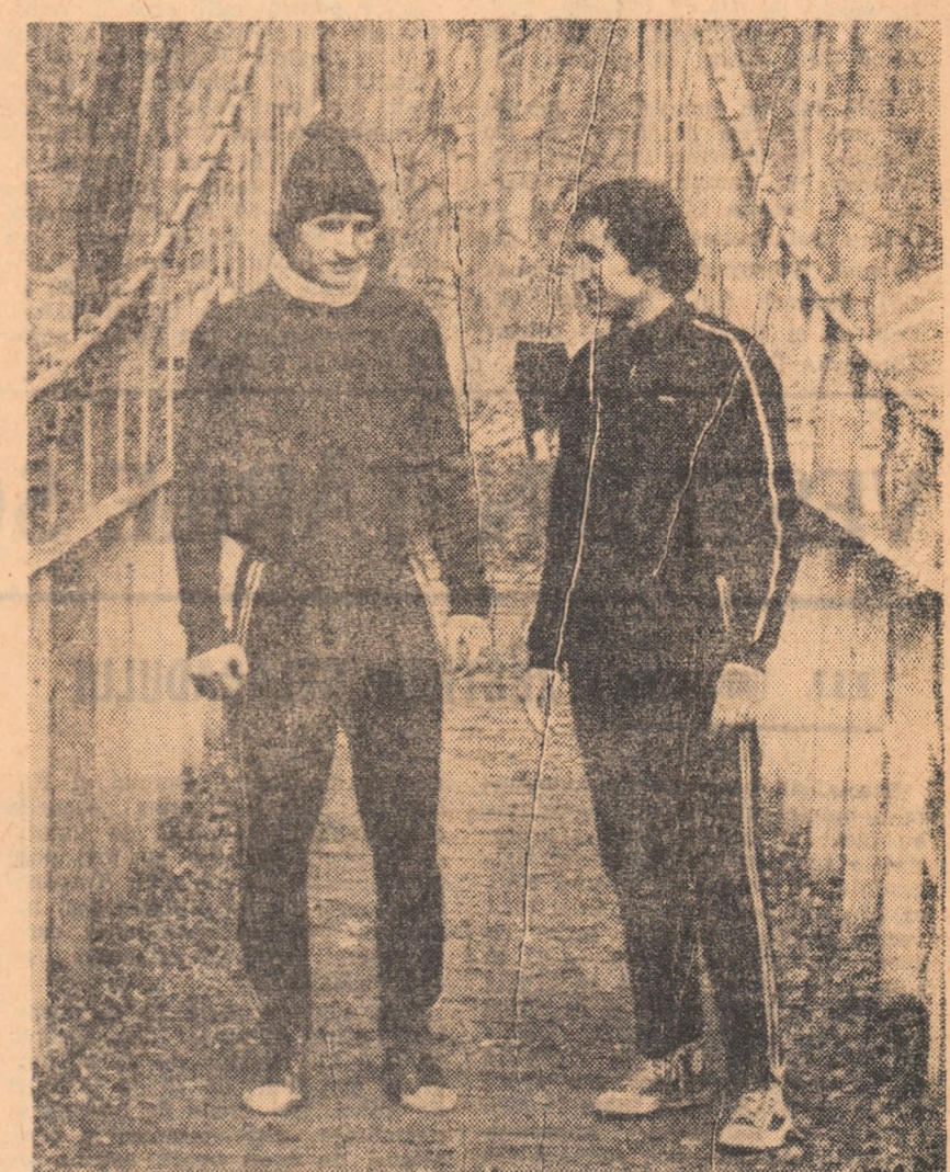
Mulțescu și Roznai pun la cale „asaltul de primăvară”