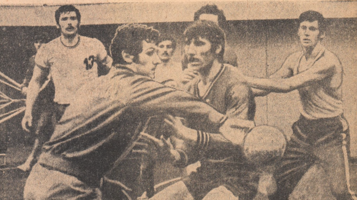
Apărarea „giganților” încearcă să stopeze un atac subtil. Fază din antrenamentul de ieri al handbaliștilor noștri.

Meciurile cu Bulgaria au pus punct unei etape de pregătire a lotului reprezentativ de handbal al României. Alina, ultima dinaintea celui de al 8-lea turneu final al campionatului mondial, programat între 28 februarie și 10 martie, a început ieri după amiază în sala Floresca din Capitală. Reuniți în jurul celor doi tehnicieni — antrenorii emeriti Nicolae Nedel și Oprea Vlase — 19 handbaliști, plini de speranțe, dornici să-și completeze pregătirea, au reînceput migăloasa muncă de recuperare a carențelor semnate în evoluțiile anterioare.