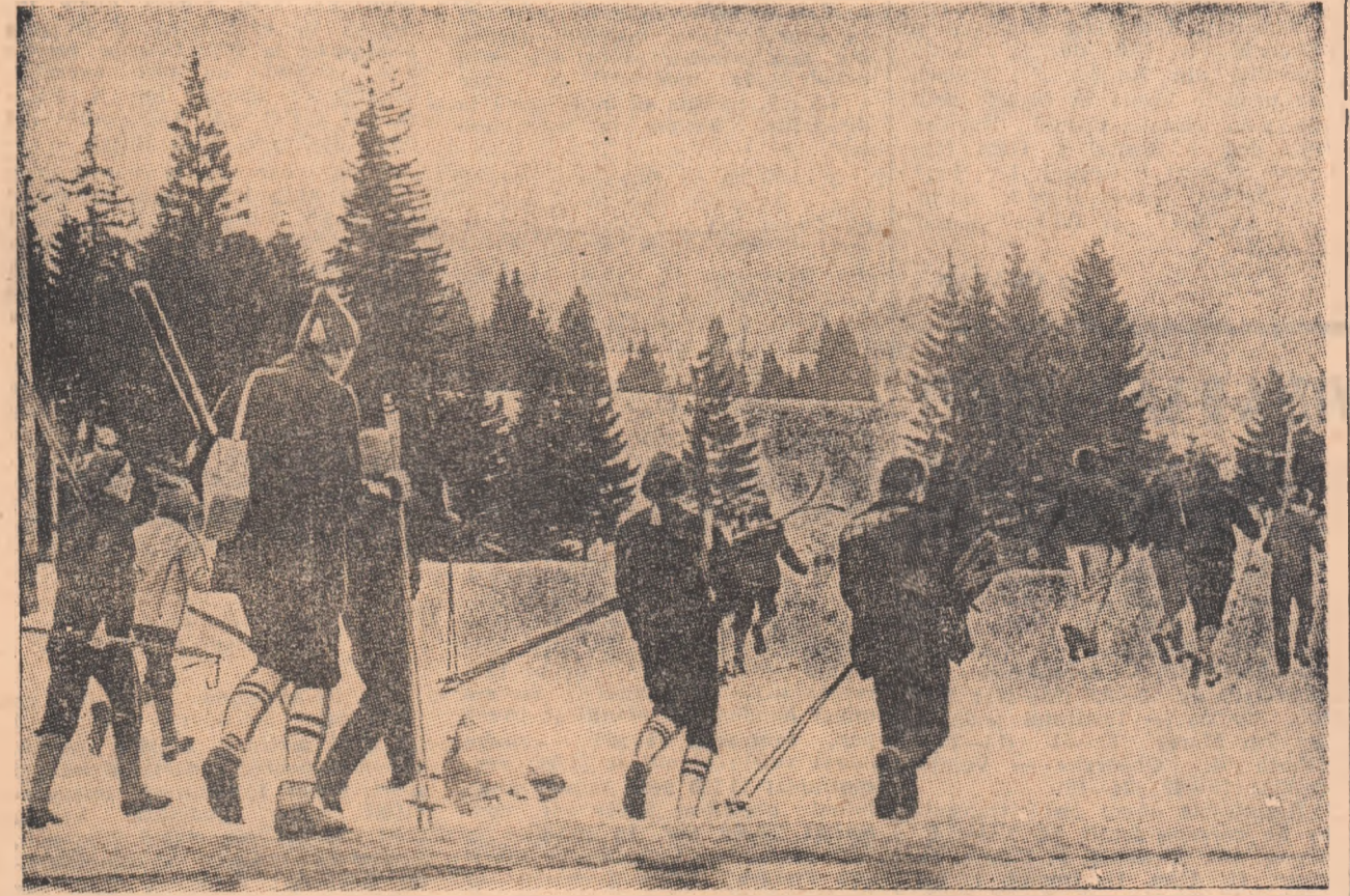
La Poiana Brașov, spre locurile de start ale întrecerilor de schi din cadrul „Cupei tineretului”