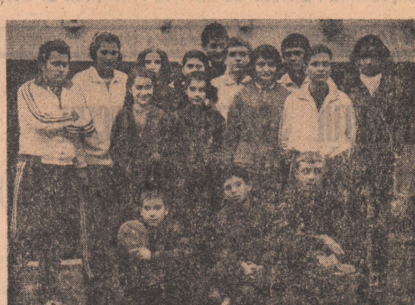
Reprezentanții Școlii sportive din Craiova, învingători în competiția de la Rm. Vlcea