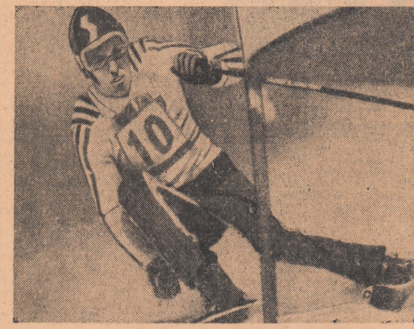
La succesele sale în Cupa mondială, schiorul italian Gustavo Thoeni a adăugat, acum, și titlul de campion mondial la slalom urias.