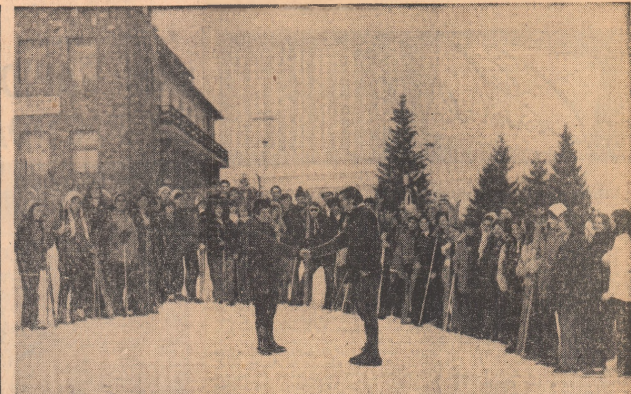
În zilele vacanței, elevii liceului „Dumitru Petrescu“ din București au participat la numeroase întreceri de schi — organizate la Pîrîul Rece — în cadrul primei etape a „Cupei tineretului“.