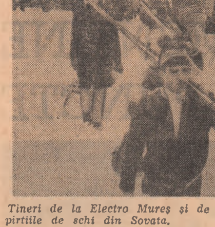
Tineri de la Electro Mureș și de la Metalotehnica din Tg. Mureș, pe pirițele de schi din Sovata.

Pentru anul 1974, spunea președintele comitetului sindicatului, asociația sportivă din Pitești s-a organizat în continuare „Cupa Dacia”, festivalul sportului feminin și, la sfîrșitul fiecărei săptămîni, o „zi a alergărilor”.