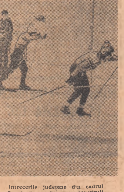
Intrecerile județene din cadrul „Cupei tineretului” au constituit o repetiție generală înaintea finalului...