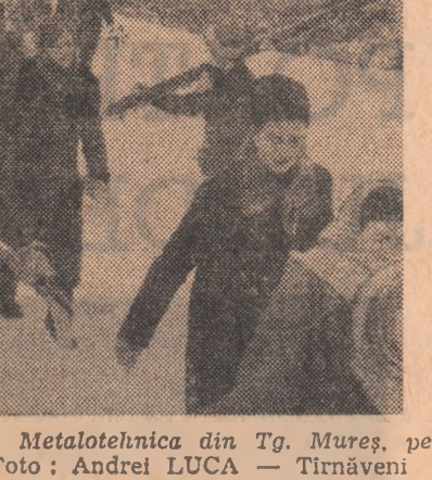
Tineri de la Electro Mureș și de la Metalotehnica din Tg. Mureș, pe pirițele de schi din Sovata.