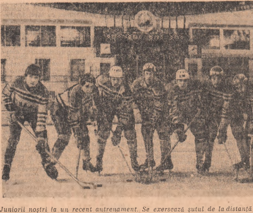
Juniorii noștri la un recent antrenament. Se exercesază șutul de la distanță