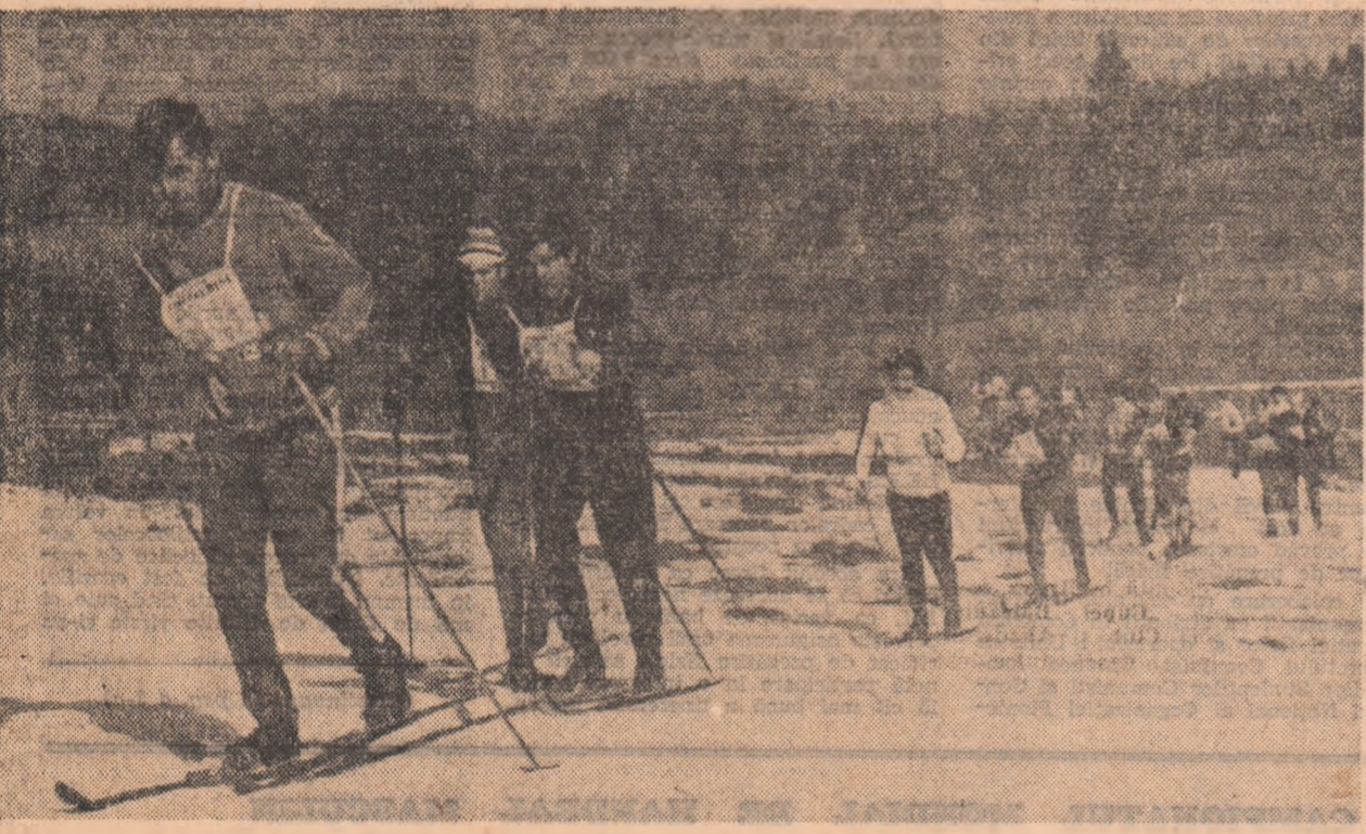
Un urcuș din cursa băleilor, atacat cu mult aplomb. Soarele a topt zăpada, dar organizatorii au găsit soluții ca întrecerile să nu aibă de suferit.