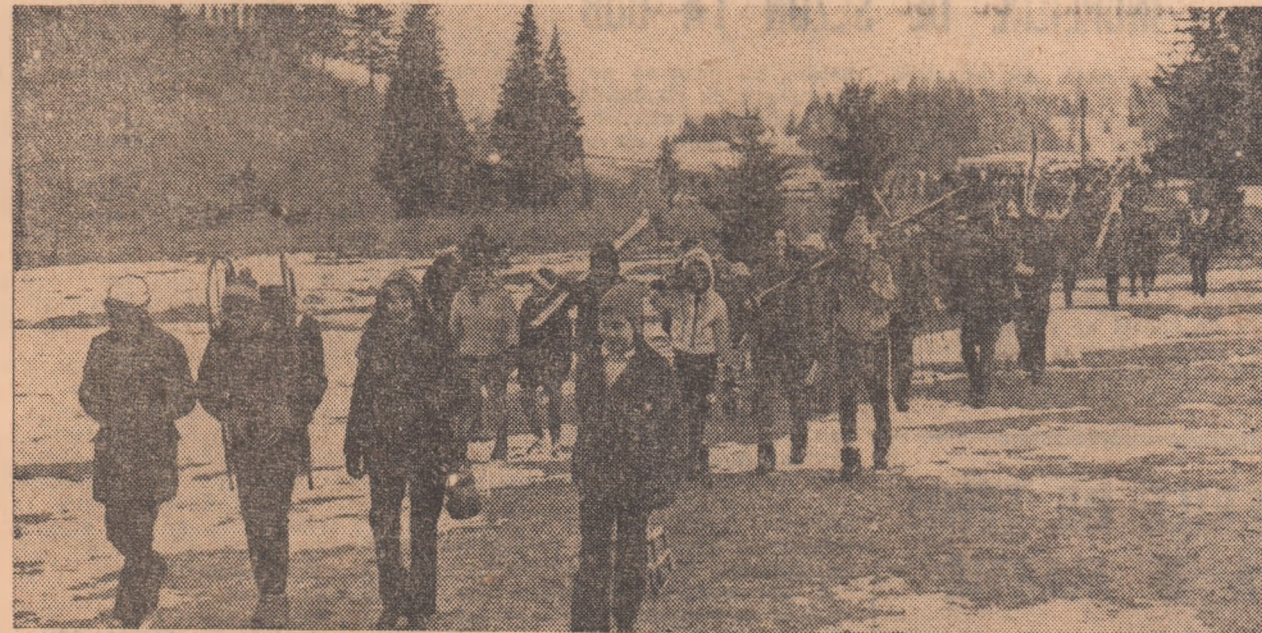
Festivitatea de premiere a luat sfârșit. Participanții se îndreaptă spre autocare. Fiecare pleacă din Poiana Brașov cu amintirea de neuitată de la participarea la finala pe țară a „Cupei tineretului”

Virgil Cazacu prim-adjunct al ministrului educației și învățământului