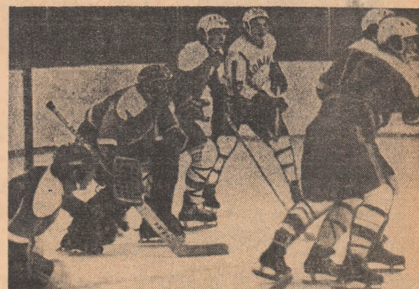
Apărarea echipei Bulgariei pusă la grea încercare de ofensiva jucătorilor români. (Fază din jocul de miercuri, 6—1 în favoarea României)