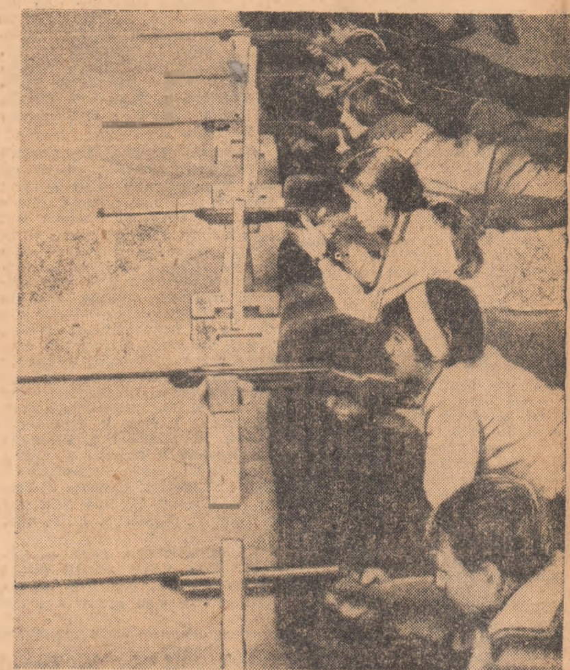
Cițiva dintre pionierii care au participat la concursul de tir găzduit de Școala generală nr. 76 din Capitală

Duminică dimineață am fost oaspeții Școlii generale nr. 76 din Sectorul IV al Capitalei, gazda etapelor penultime a competiției de tir cu arcuri organizată pe sector a marcat, totodată, deschiderea ediției de vară a „Cupai tineretului”. În săptămânile care au trecut, în toate școlile generale ale sectorului au avut loc etape preliminare inter-clase, menite să facă o selecție printre concurenții. De precizat faptul că una dintre condițiile participării la fazele superioare ale întrecerilor a fost situația la învățătură. De altfel, întreaga competiție a avut ca deviză: „Buni la învățătură, buni la sport!”. Înaintea de a consemna rezultatele tehnice ale concursului, să apreciem că el a fost bine organizat de Consiliul organizației pio-