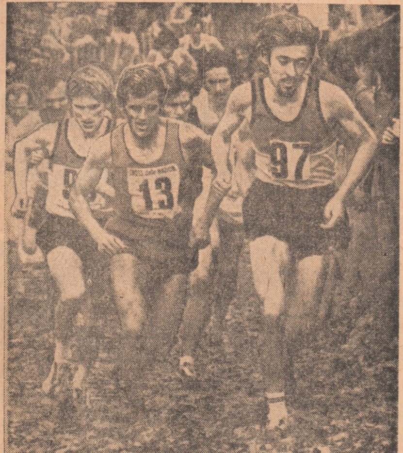
Pe pista hipodromului din Monza (Italia) s-au disputat întrecerile tradiționalele cross internaționale „Marele premiu al națiunilor”...