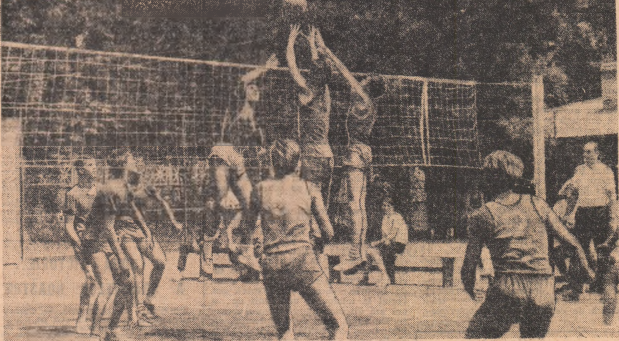
Reprezentanții Școlii sportive nr. 2 din București s-au făcut remarcări nu numai în activitatea sportivă desfășurată pe plan intern, ci, paralel, și în cea internațională...