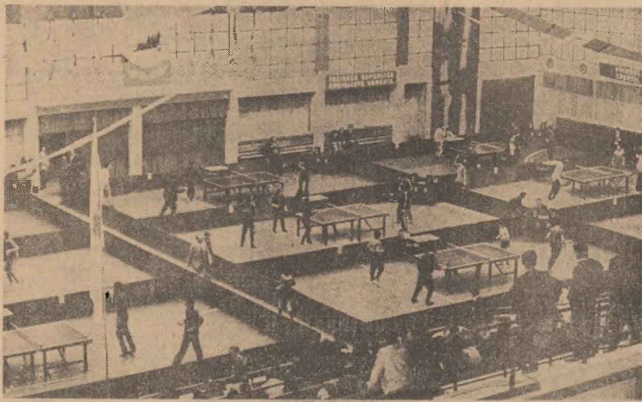
Vedere panoramică a sălii sporturilor „Victoria” din Ploiești în timpul desfășurării finalelor