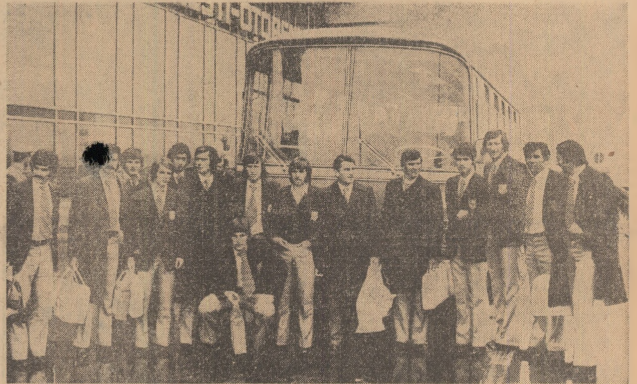
Fotbaliștii de la O.F.K. Belgrad, în fața aeroportului internațional Otopeni, la cîteva minute de la sosire