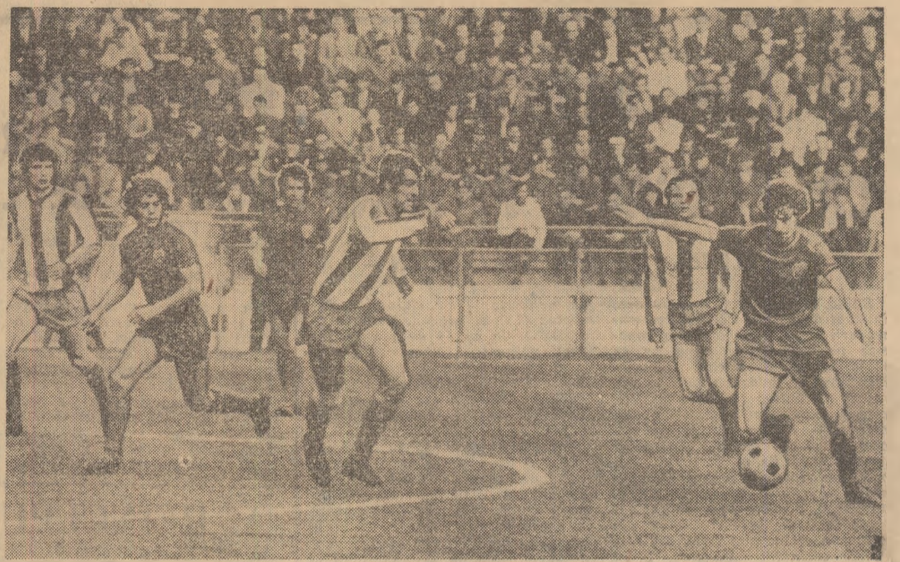
Năstase (dreapta) șutează puternic, de la distanță, la poarta lui O.F.K. Belgrad