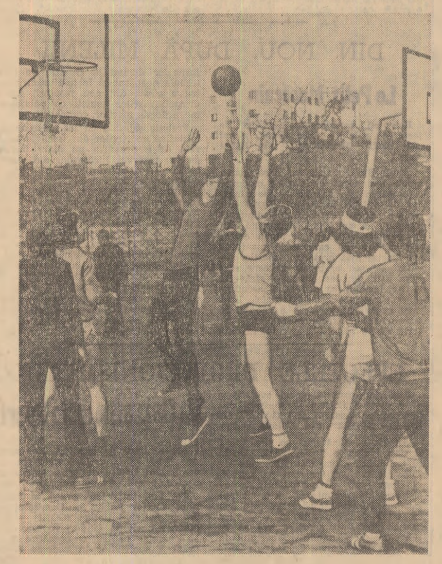
Terenurile de la „Regie" sînt solicitate din plin de întrecerile prilejuite de „Cupa tineretului", dată un aspect dintr-un îndrăgît meci de baschet inter-facultăți.