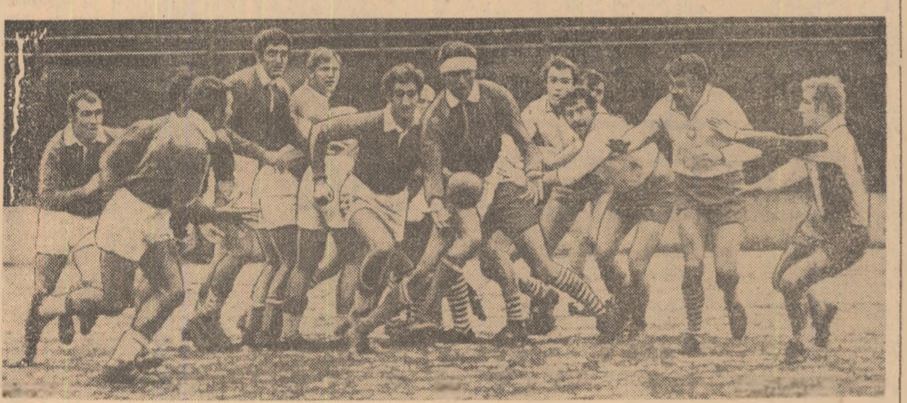
Un aspect de la ultima întâlnire dintre rugbyștii români (în tricouri de culoare închisă) și cei polonezi, care a avut loc la București (16-3)