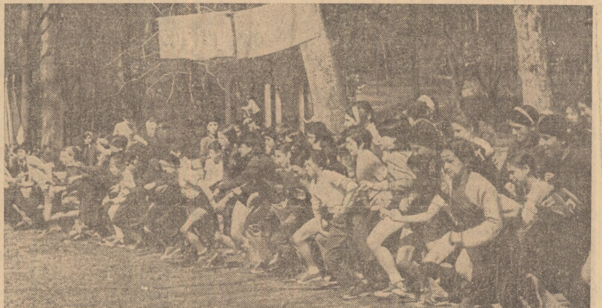
Dintre crosurile săptămîinii trecute, cel organizat pe aleile Palatului pionierilor s-a bucurat de un mare succes de participare