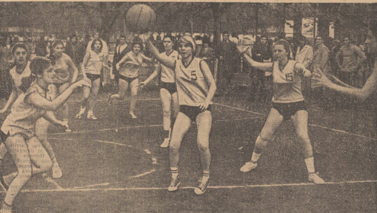
Moment de mare interes din meciul pentru locul întâi la baschet fete, între echipele A.S.E. și I. P. București.