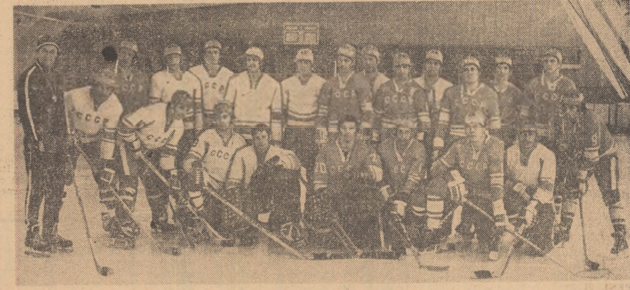
Echipa U.R.S.S. — campioană mondială de hochei, ediția 1974. Primul în stînga, antrenorul principal, maestrul emerit al sportului Vsevolod Bobrov.