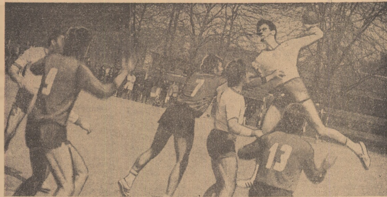
Fază din meciul Dinamo București — Independența Sibiu, disputat ieri pe terenul din parcul sportiv Dinamo.