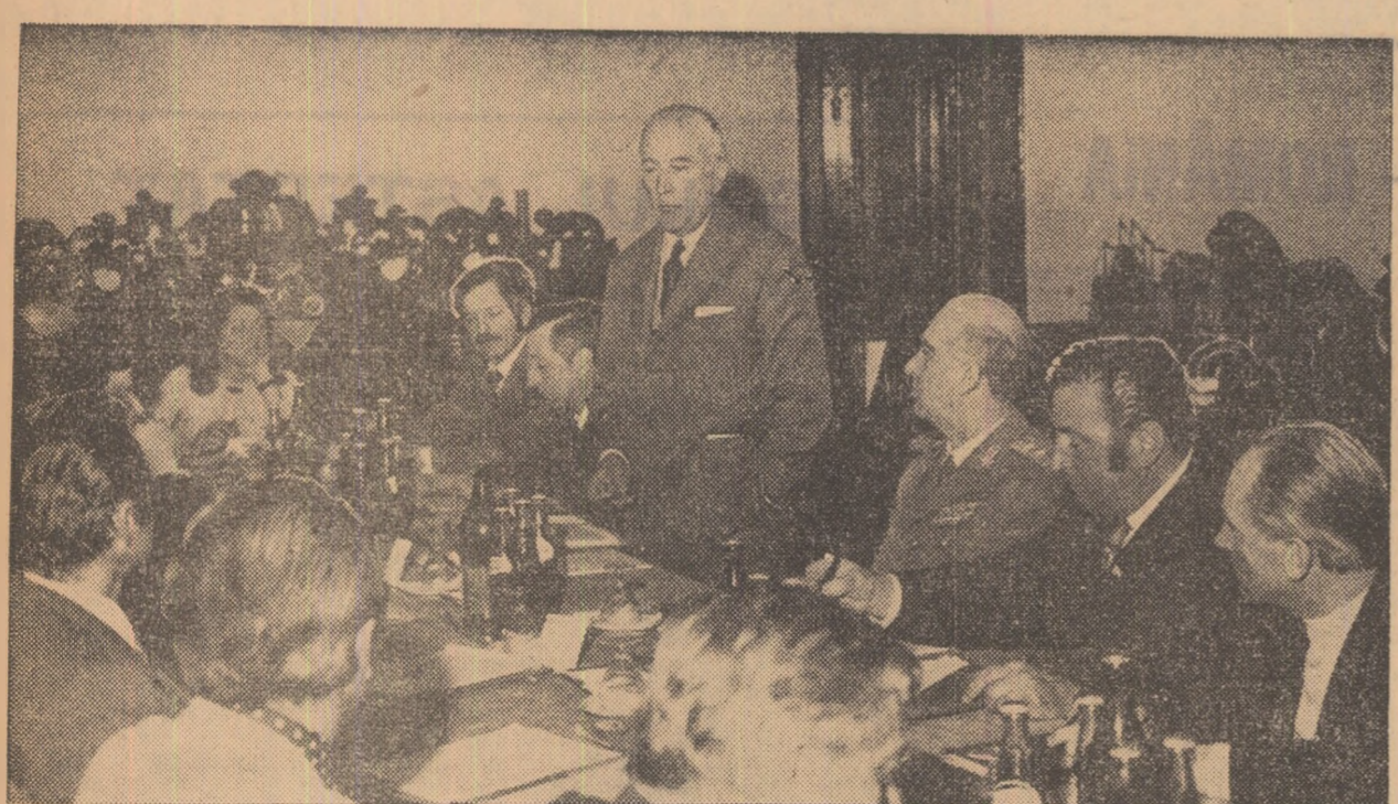
Aspect din timpul desfășurării reuniunii comisiei tehnice a F.I.C.

SIMBĂTĂ ȘI DUMINICĂ A AVUT LOC LA BUCUREȘTI