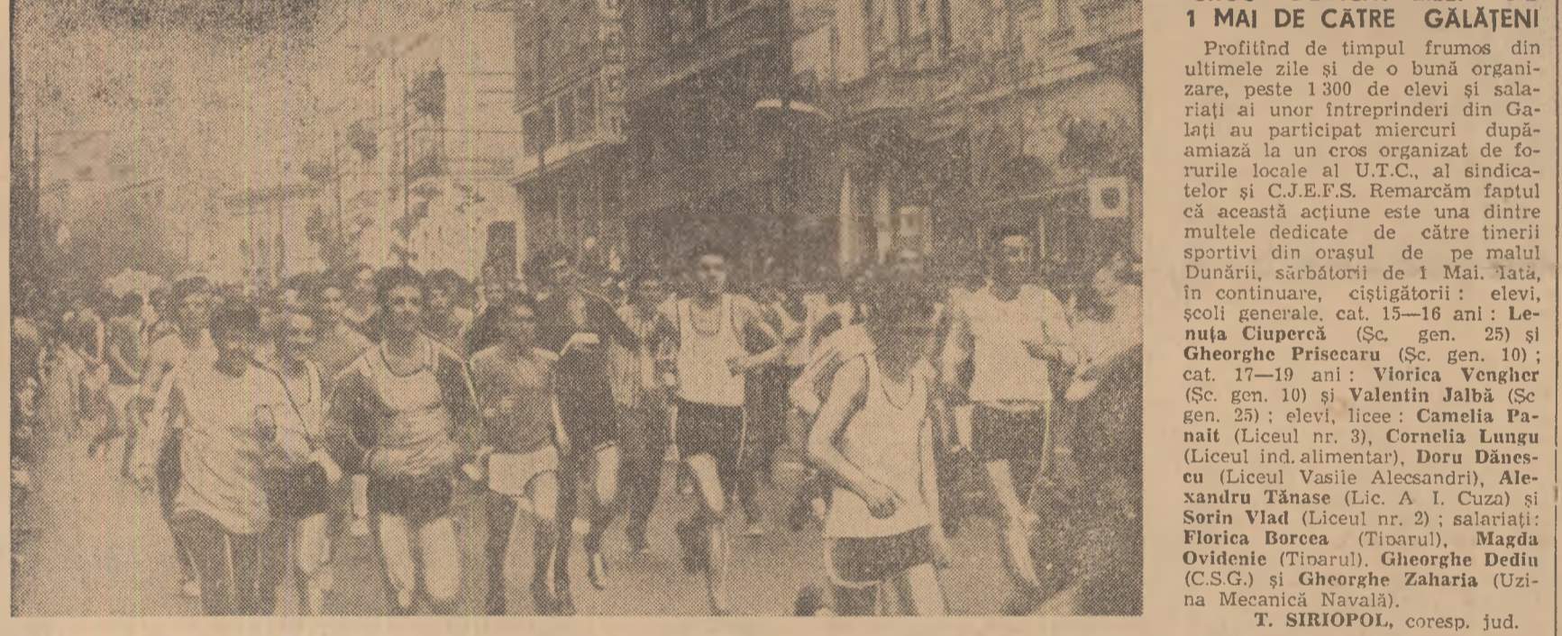
S-a dat plecare în cursa de 1 100 de metri rezervată băieților

IERI, ÎN ORGANIZAREA C.E.F.S. AL SECTORULUI VI APROAPE 6000 DE PARTICIPANȚI LA CROSUL „SĂ ÎNTÎMPINĂM 1 MAI”