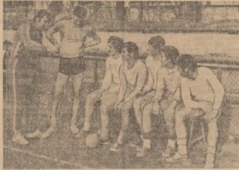
HANDBALIȘTII DE LA ȘCOALA SPORTIVĂ NR. 3 BUCUREȘTI SE AFIRMĂ