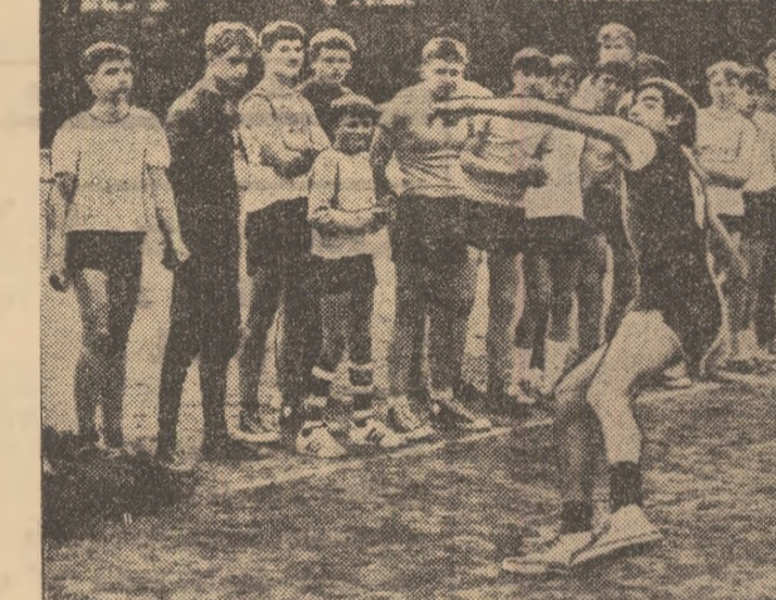
Aruncarea mingii de oină a prilejuit relevarea unor autentice speranțe pentru atletism.

Și iată că la sfârșitul lunii aprilie, în avanpremiera sezonului athletic în aer liber, prima mare acțiune din acest plan s-a desfășurat cu succes. Timp de zece ore, stadionul C.F.R. din Timișoara a fost în exclusivitate al celor mai mici candidați la prima disciplină olimpică, aproape 1200 de pionieri și școlari, campioni, din 186 școli generale din județul Timiș.