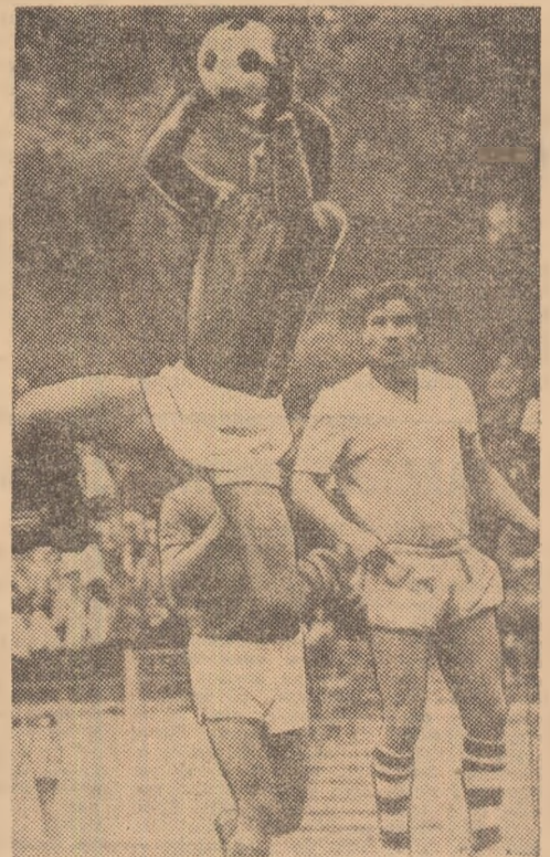
(Citit în pag. 2-3 cronicile celor patru meciuri)