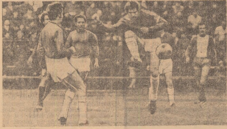
Secvență din partida Autobuzul București — Nitramonia Făgăraș 3—1.

Turzii: A. ENE (Craiova) • Mureșul Deva — C.F.R. Timișoara: GH. RACZ (Brașov) • F. C. Bihor — Corvinul Hunedoara: T. ANDREI (Sibiu) • Minerul Anina — Gloria Bistrița: F. COLOSI (București) • Vulturii Textila Lugoj — Minerul Căvinic: C. DINULESCU (București) • Textila Odorhei — Victoria Carei: C. IONITA I (București).