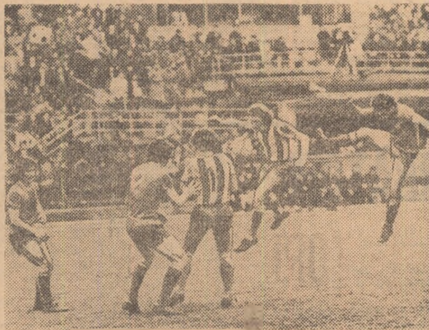
Moment (rar) de panică în careul Stelei: la o centrare de pe aripa dreaptă, Domide va trimite puternic cu capul peste „transversală”. Faza din meciul Steaua — U.T.A., disputat, miercuri, la Ploiești, în sferturile de finală ale „Cupei României”.

În fiecare an, atunci cînd „Cupa” ajunge aproape de faza finală și competiția este mai mult în atenția publicului, încep să i se vadă și... fisurile. Cea mai mare — din care derivă și toate celelalte — este aceea că acestei importante și spectaculoase întreceri, în care toate formațiile fotbalului nostru pornesc de pe poziții egale, indiferent de categoria în care activează, nu i se acordă, în continuare, importanța cuvenită. Mai întîi de cei ce o programează și apoi — ca o urmare firească — de cele mai multe dintre formațiile calificate. Miercuri, această realitate crudă