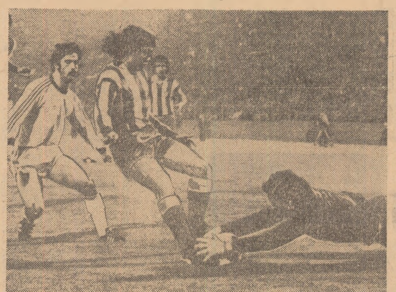
Eusebio îl protejează pe Reina de intervenția lui Gerd Müller. Fază din meciul Bayern și Atletico (1-1).