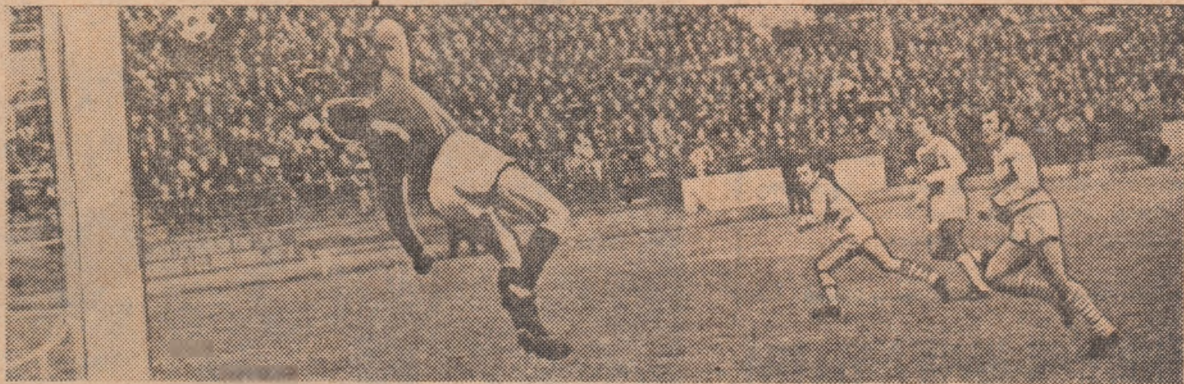
Cavai pus în dificultate de atacanții clujeni. (Moment din partida C.F.R. Cluj — Dinamo disputată în toamnă la Cluj; „actul al doilea” al disputei are loc miine, pe stadionul „23 August”)

O nouă etapă (a XXXII-a) în campionatul Diviziei A de fotbal, miine pe stadionul Capitalei și ale provinciei. Etapă „văzută”, de conducătorii secțiilor de fotbal, care, în afara unor scurte considerații-previzuni, se vor ocupa și de aspectul educativ al întrecerilor, un factor de maximă importanță la ora actuală. Dar, să le dăm cuvântul: