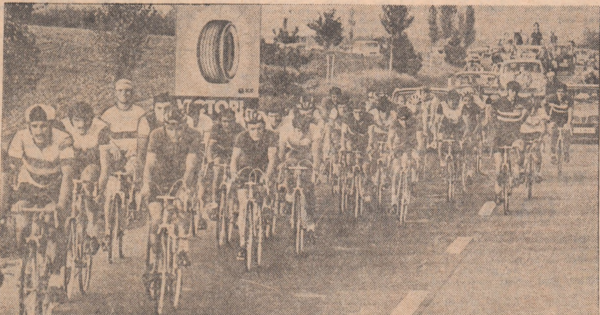
Un aspect din etapa Buzău — Vălenii de Munte — București, ultima din Turul ciclist, ediția 1973

„Turul României”, eveniment sportiv de deosebită importanță, închinat celei de a XXX-a aniversări a Eliberării și celui de al XI-lea Congres al partidului, începe peste două zile. Cicliștii români și-au încheiat pregătirile, cei de peste hotare au început să sosească în Capitală. Organizatorii, comisiile locale, oficialii se alină — și ei — în febra de start. „Marea buclă”, înconjurul țării pe biciclete ajuns la a 20-a ediție, este amplu prezentat în pagina a 8-a a numărului nostru de astăzi. Primele sosiri, reportaj printre rutierii români, descrierea traseului ce va fi străbătut de cei 70 de cicliști între 10 și 23 iunie, amănunte privind competiția — iată câteva din rubricile paginii dedicate „Turului României”.