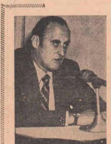
JOAO HAVELANGE este născut la Rio de Janeiro, la 8 mai 1916. De profesie avocat, deține postul de director al unei mari companii de transporturi rutiere braziliene, Polisport, a fost mem-

Cu 96 de voturi pentru s-a hotărît ca la turneul final al celui de-al 11-lea campionat mondial ce va avea loc în anul 1978 în Argentina să participe 20 de echipe: deținătoarea titlului, țara organizatoare, plus 18 formații calificate în urma jocurilor preliminare.