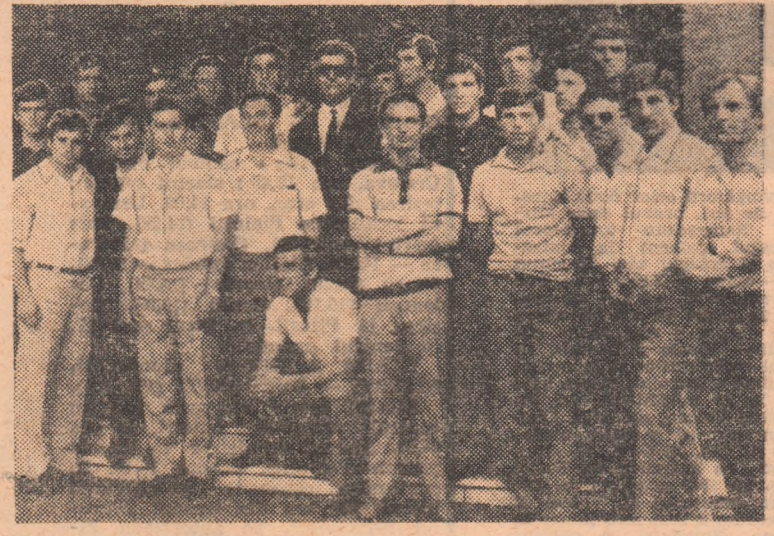
Dintre echipele oaspe, reprezentativa de tineret a Albaniei era singura care sositise in Capitala pînă ieri duna-amiară, iar-i pe fotbalistii de la Adriatica, zimbînd, incercători in forțele lor, fotoreporterul nostru Stefan Ciotov.

Amplina s-au si Timi- din cadrul meului fi- cu urmă- Pro- F.C. Ar- Steaua „23 fotbal Ba- — Uni- Petrolul Arges — — Li- — Steaua Cra- A.S.A. Tg Cugir — — T.A. — — 0-2. Hunedoara Trico- — — 1-0 Cugir