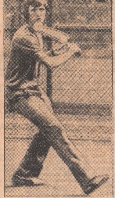
Joi și vineri au fost zile de pauză la Weltmeisterschaft. Destindere binemeritată pentru jucători și mai puțin pentru antrenori, mereu în căutarea formulei ideale. Iată-l aici pe cunoscutul jucător olandez Cruyff într-un moment de relaxare, jucînd tenis.