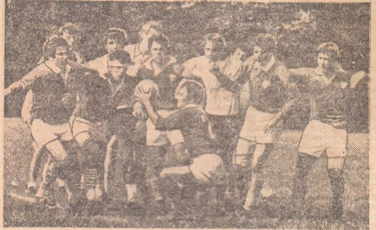
Tânăra echipă a Griviței Roșii are meritul de a fi (fotografie) în fața de luptă pentru titlu până în ultimul moment al campionatului. Iată, în fotografie, pachetul său de înzestrări protejindu-și mijlocul de grămadă, în meciul cu „Poli“ Iași.