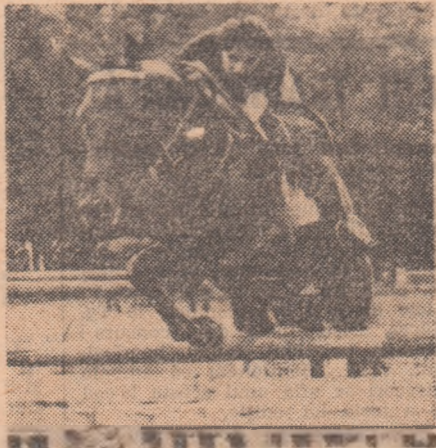
Norica Petric cu Ghiocel, surprinsă la ultimul antrenament înaintea startului în „Concursul Prietenia”

De asemenea, în cele trei zile de concurs vor putea fi urmăriți și componenții lotului național de seniori, care se pregătesc pentru apropiatele confruntări internaționale.