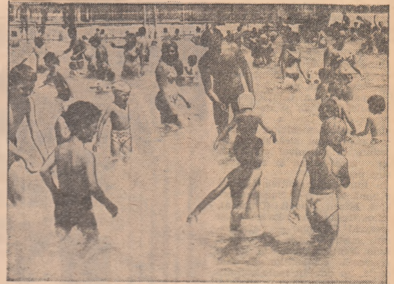
La ștrandul Tineretului din Capitală, o grupă de copii în momente de relaxare după lecția de înot