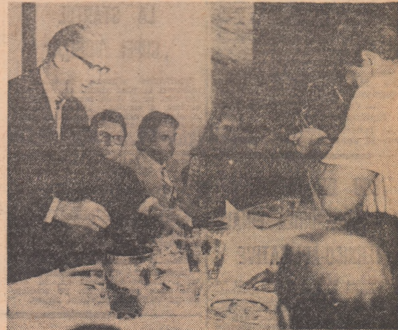
Secvență din timpul tragerii la sorți: arbitrul întîlnirii, belgianul H. de Coninck, pune în urne bilețelele cu numele celor patru jucători care vor evolua în partidele de simplu

în fața startului mult așteptat. Îi vedeți pe „cei 4” așezați în perechi în tabelul alăturat, ordinea în care numele lor au ieșit