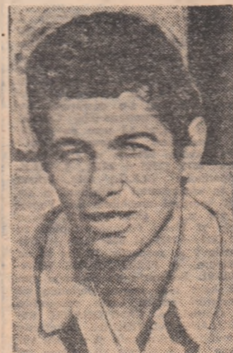
MIRCEA LUCESCU va susține astăzi seară cel de-al 48-lea meci al său în echipa națională, egalînd astfel vechiul record al lui Iuliu Bodola

În pag. 2-3: PROGRAMUL TURULUI CAMPIONATULUI DIVIZIEI A DE FOTBAL 1974/1975