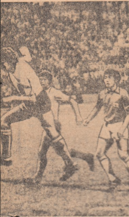
noastre din meciul România — Japonia

RAȚII ciuri, jucătorilor să li se niveleze pregătirea, la cluburile respective”. MIRCEA LUCESCU: „Sînt fericit că am egalat un vechi record, acela al lui Bodola, cu 45 de selecționari în reprezentativă. Meciul a fost mai dificil decît am crezut, japonezii a lărgind enorm în teren. Salut ideea de a angaja de data aceasta o partidă internațională încă de la începutul sezonului, pentru a evita tratarea cu ușurință a problemelor echipei naționale.”