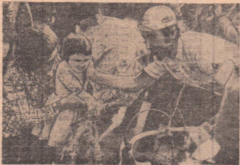
Flori pentru „tăticu” oferite de mama și fetiță, după câștigarea Turului Franței

Eddy își iubește familia, copiii. Se bucură enorm cînd se află în mijlocul lor. Îi place mult felul în