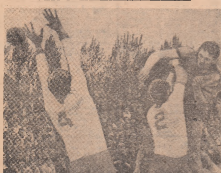
Faze ca aceasta surprind într-unul dintre cele trei loturi Steaua — Dinamo din campionatul trecut, pline de dinamism, se fac să strângă cu interes startul noii ediții a divizion A.