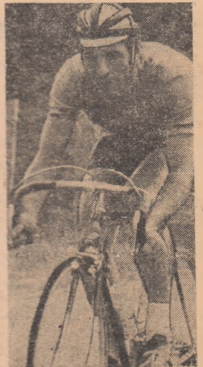
Buc.) 5 p. 10. G. Hianu (Dinamo) 5 p.

CLASAMENT : 1. Vasile Teodor (Dinamo) 3 p. (1 h 21:14), 2. V. Selejan (Dinamo) 28 p. 3. T. Puteșiu (Metalul Plopieni) 24 p. 4. G. Negoescu (Steaua) 22 p. 5. I. Valenut (Dinamo) 32 p. 6. C. Iulian (Metalul Plopieni) 18 p. 7. S. Brezeanu (Voința Buc.) 15 p. 8. St. Ene (Steaua) 5 p. 9. S. Suditu (Olimpia