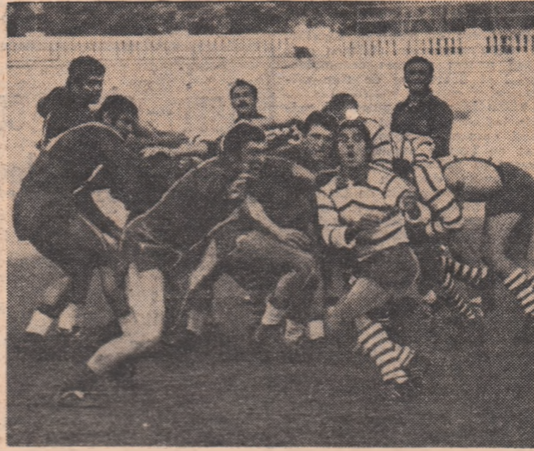
Tîndrul mijlocăș la grămadă Paraschiv — distribuit cu clarviziune baloanele liniei sale de treisferturi. (Fază din meciul Dinamo — Steaua 15—12).