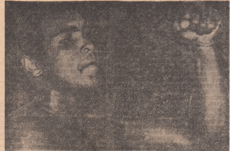
Sosit la Kinshasa, Cassius Clay a și efectuat primul antrenament.

vingător, Foreman pornește ca favoritul, dar este prea lent. Cred că voi câștiga prin K. O. în primele reprize”. La rîndul său, George Foreman, aflat și el în drum spre Kinshasa, a declarat zărilor că presupusa viteză în ring a lui Cassius Clay