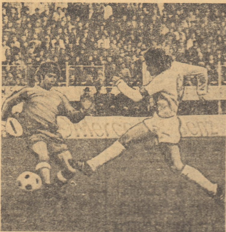
Dinu în luptă cu Heredia (At- letico Madrid). Secretul din evo- luția dinamoviștilor în trecuta ediție a cupelor europene, cind ei au înfrânt pe campioana Spa- niei.

minică sufe- s cu severul rmină și nu prea simțim sperie ceva: pe care l-am situatea a ju- și și care ar ipa pe care Ne cunoaș- pe alții ca să In orice caz, m fi și tele- să lășăm o ului român un rezultat Cit privește stabilă decât marți după- foarte mulți a campionat, locul IV. e-a zdrunci-