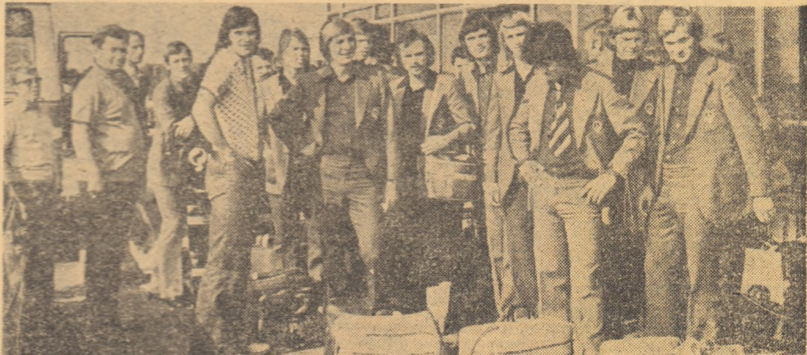
Lotul fotbalistilor suedezi, la cîteva minute după sosirea lor la Otopeni