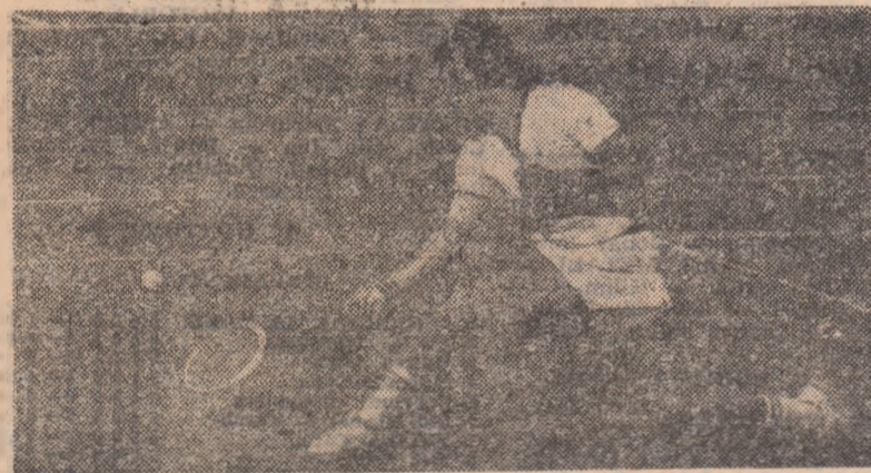
Dumitru Hărădău — pentru prima oară campion de seniori al țării