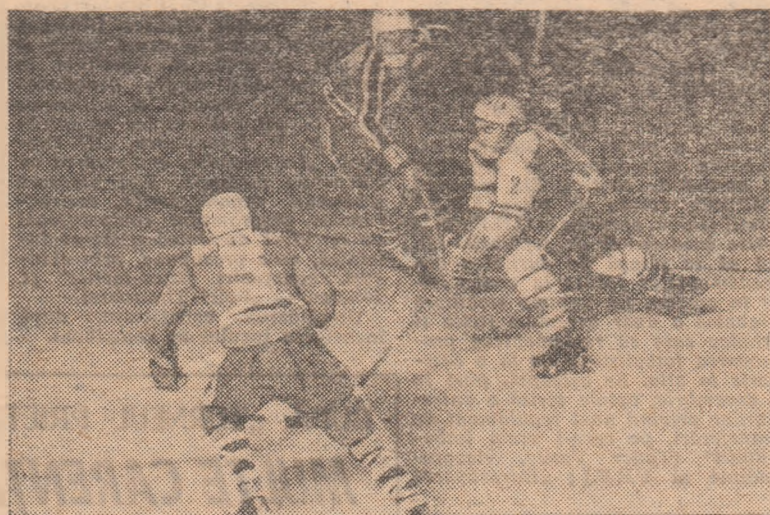
Tîrnava Odorhei a fost revelația ultimelor etape, prin două meritate victorii asupra Agronomiei Cluj și A.S.E. București. Iată-i în fotografia noastră pe hocheiștii acestei formații în meciul susținut cu Dinamo București

A.S.E. BUCUREȘTI — LICEUL NR. 1 M. CIUC 6-1 (0-1, 3-0, 3-0). Surpriza care se prefigura după prima repriză a durat doar... 22 de minute. Calmîndu-se, la pauză, hocheiștii bucureșteni au evoluat în reprizele a II-a și a III-a la adevărata lor valoare, reușind să-și concretizeze superioritatea prin câteva goluri frumoase. În prima parte, însă, mai ales după ce elevii au deschis scorul,