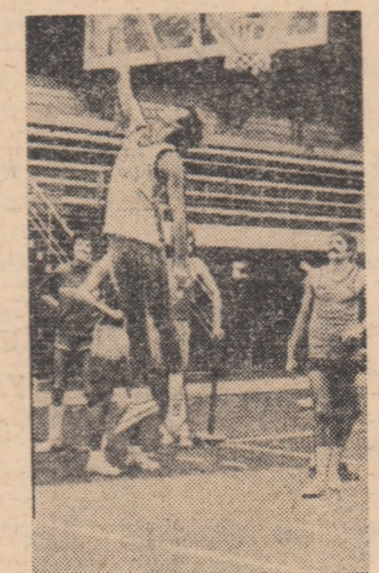
Trecerea normelor de control a constituit un prilej de verificare a pregătirilor. În fotografie, imagine de la examenul normelor dat de echipele bucureștene

pid; etapa a VI-a, 17 noiembrie: CSU — „U” Iași, Constructorul — Politehnica, I.E.F.S. — Olimpia, Voinea — „U” Cluj, Pedagogic — Crișul, Rapid — „U” Timișoara; etapa a VII-a, 24 noiembrie: Rapid — CSU, „U” Iași — Constructorul, Politehnica — I.E.F.S., Olimpia — Voinea, „U” Cluj — Pedagogic, „U” Timișoara — Crișul; etapa a VIII-a, 1 decembrie: Constructorul — Rapid, I.E.F.S. — „U” Iași, Voinea — Politehnica, Pedagogic — Olimpia, Crișul — „U” Cluj, CSU — „U” Timișoara; etapa a IX-a, 8 decembrie: CSU — Constructorul, Rapid — I.E.F.S., „U” Iași — Voinea, Politehnica — Pedagogic, Olimpia — Crișul, „U” Timișoara — „U” Cluj; etapa a X-a, 5 ianuarie: I.E.F.S. — CSU, Voinea — Rapid, Pedagogic — „U” Iași, Crișul — Politehnica, „U” Cluj — Olimpia, Constructorul — „U” Timișoara; etapa a XI-a, 12 ianuarie: Constructorul — I.E.F.S., CSU — Voinea, Rapid — Pedagogic, „U” Iași — Crișul, Politehnica — „U” Cluj, „U” Timișoara — Olimpia.