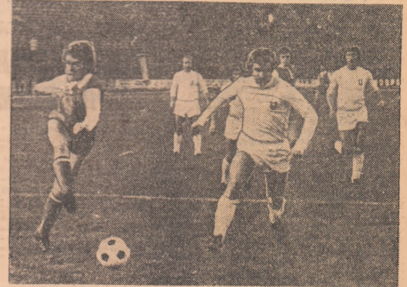
Acțiune de atac în zona porții, care scoate în evidență tempoul susținut al alergării efectuată numai de jucătorii angajați în lup- ta pentru balon. În rest, ritm lent sau pur și simplu... spectatori în teren (Fază dintr-un meci U.T.A. — Universitatea Craiova)

Cu alte cuvinte spus, jucătorii din țările cu fotbal avansat aleg- gă cu mai mult folos. Și acest l- cru el îl fac firesc și simplu, ca urmare a unei pregătiri în cadrul căreia problema dozării volumu- lui, intensității și a complexității efortului este rezolvată în mod judicios, corespunzător exigențelor