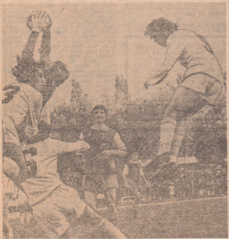
O fază care ilustrează atît asaltul lui Dinamo (din repriza a doua) la poarta lui F. C. Köln, cit și imbatabilitatea portarului Schuhmacher. Acesta reține sigur balonul, între Sătmăreanu II, Dinu și Dumitrache.