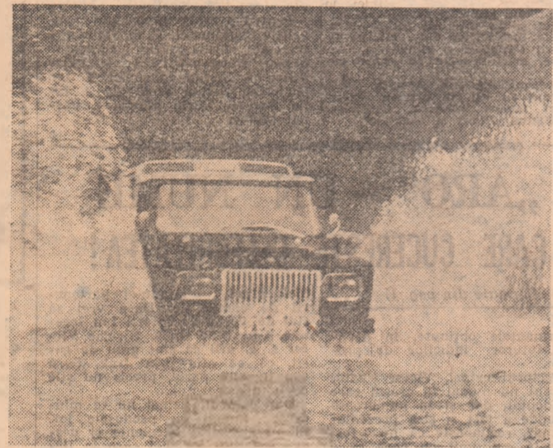
ARO trece cu succes cele mai dificile obstacole

foșt doar cîteva dintre mașinile depășite cu brio de ARO. Și așa, încet, încet, ARO a devenit la fel de cunoscut pe toate meridianele lumii, la concurență cu performanțele lui Ilie Năstase sau ale handbalștilor noștri.