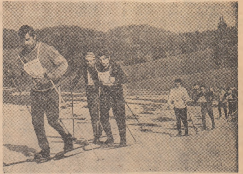
În plin concurs, pe pîrțile inzăpezite ale Poienii Brașov. Aspect de la finala primei ediții de iarnă a „Cupei Tineretului”

În fine, pentru asigurarea succesului competiției se impune o largă și susținută popularizare, prin toate mijloacele, începînd din școală și facultate pînă la nivelul ultimei asociații sportive sătești. Stă la îndemîna organizatorilor sportivi de a-și pune în valoare toată imaginația, tot spiritul de inițiativă pentru a atrage în întrecerile „Cupei Tineretului” cît mai mulți participanți, băieți și fete.