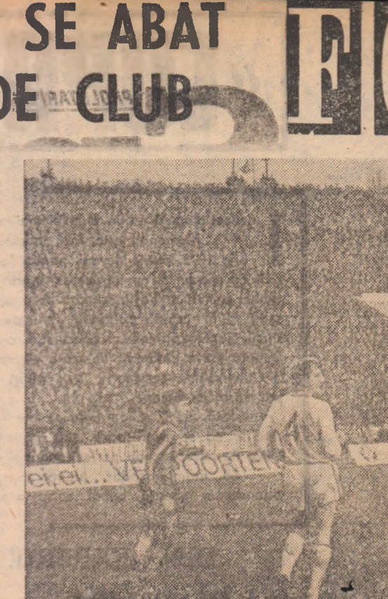
STEAUA — BAYERN MÜNCHEN 1-1, pe „23” ale echipei lui Sătmăreanu. În această fază, fund doli: Schwarzer

acest decalaj valoric, accentuat de decalajul profilului să menționăm că în disputele cu trinomialul Anglia-R.F. Germania-Olanda, echipele noastre au susținut 21 de meciuri, în ultimii 10 ani, au câștigat unul singur (Petrolul, cu Liverpool), au încheiat opt jocuri la egalitate, pierzând... 12 meciuri, golaverajul general fiind cum nu se poate mai edificator: 9-52!