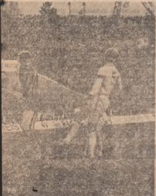
Unul dintre cele mai frumoase meciuri este încadrat de doi campioni mondiali Beckenbauer