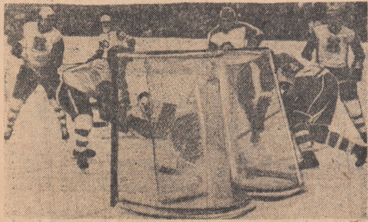
Moment din partida Steaua — Dinamo București, disputată în „Cupa României” (5-4). Dinamoviștii deschid scorul, la capătul unei faze speculatoase.

Să sperăm că această primă ediție a derbyurilor hocheiului (cea de a doua și ultima va avea loc în ianuarie 1975) va fi de bună calitate.