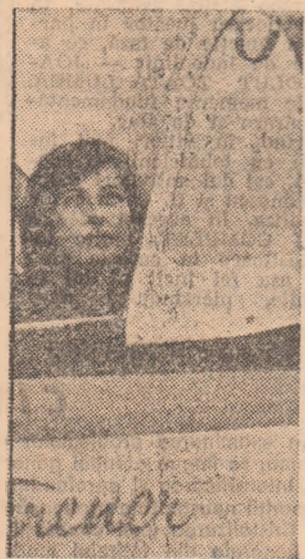
Există în sport, ca și în alte domenii de activitate, exemple de tineri care dau dovadă de un admirabil curaj de stăpînire de sine în îndeplinirea misiunii, pentru atingerea scopului propus. Despre un ase-