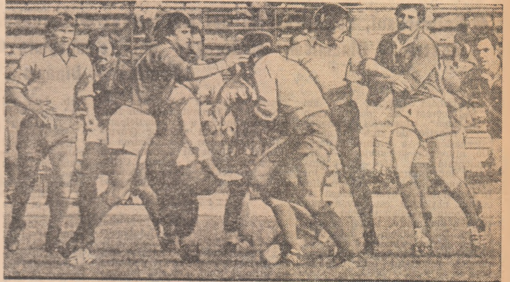
Un moment specific marit încleștării sportive dintre rugbystii români și cei francezi, în care victoria a fost decisă de spiritul colectiv al echipei noastre