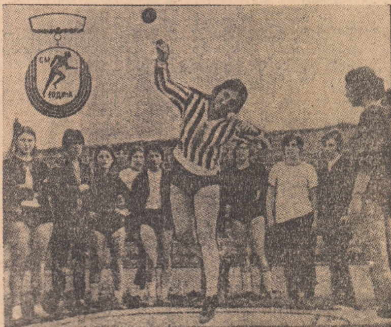
Competițiile de masă rezervate elevilor cunosc în fiecare an un mare succes în Bulgaria. Cu acest prilej sînt depistate o serie de elemente talentate, care vor fi mai apoi promovate în loturile reprezentative. În imagine, un concurs la aruncarea greutății pentru fete, în cadrul competiției de masă rezervate elevilor.