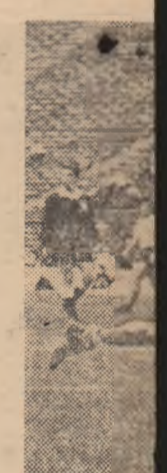
Aspect din ț

AUGUSTIN MO: „Față de program, preexistă. Rămînd prindere, celelalte meciuri. Mie mi se pare lungă față de în care se de aproximativ 11 zile se va