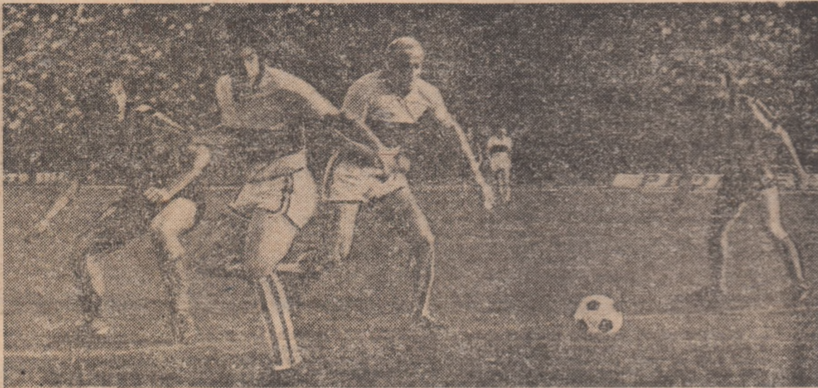
Iată o fază dintr-un meci Sportul studențesc — F.C.M. Reșița, disputat în campionatul trecut. Astăzi, pe stadionul Republicii, cele două echipe se vor afla din nou față în față în „uvertura” ultimei etape a turului.

În ultima etapă a turului Diviziei A la fotbal