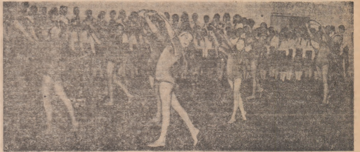
Inaugurarea sălii de sport la Școala generală nr. 56 din Capitală a prilejuit un frumos program artistico-sportiv prezentat de elevii școlii