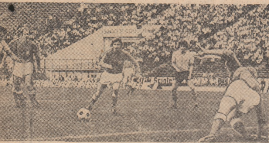
partide care a opus — la București — reprezentativele olimpice ale României și Danemarcei

NU (Dina- teea acestui soluții nu l, cu sur- premergă- —România. —loadă prea primei luni, t jocuri în că în aceste eciul olim-