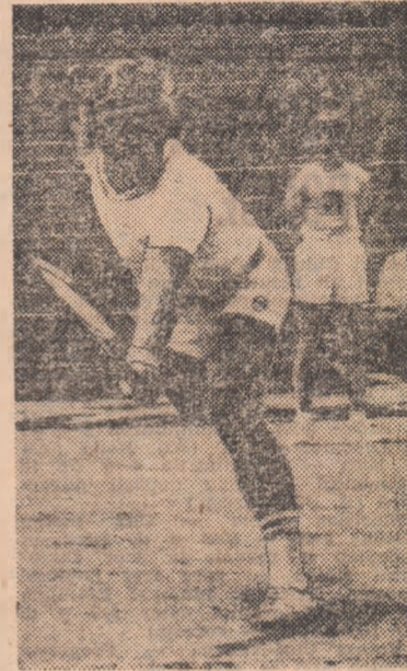
Guillermo Vilas (în stînga) și Ilie Năstase — protagoniștii marii finale de la Melbourne.

Ca și în clasamentul Marelui Premiu F.I.L.T., locul fruntaș în palmaresul tradiționalului „Masters” a fost luat de un reprezentant al generației tinere, în vîrstă de 22 de ani. Șase ani îl des-