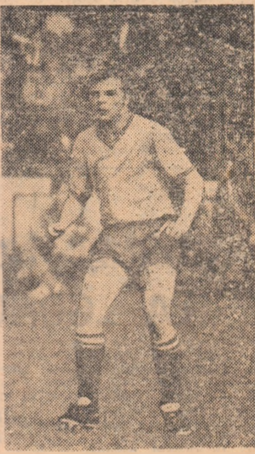
Leac — unul din cei trei jucători de... legătură între promoțiile '74 și '75 ale juniorilor „tricolori”