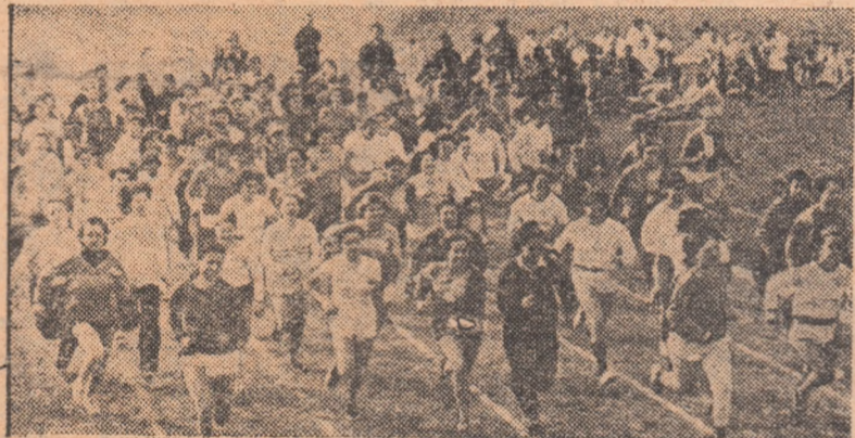
Întrecerile de cros organizate pe stadionul „Voința” din Capitală au constituit pentru participanți un prilej de trecere a normelor din complexul „Sport și sănătate”.

țării, în mediul sătesc, fapt relevat și de prezența a sute de mii de participanți la trecerea probelor și a normelor. Din sondajele întreprinse de către inițiatori au fost depistate, însă, unele aspecte