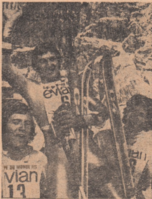
Printre primii învingători ai sezonului s-au numărat (de la st. la dr.): austriecii Werner Grissmann și Franz Klammer, vest-germanul Michael Veith, văzuți aici pe podiumul de la Val d'Isère.