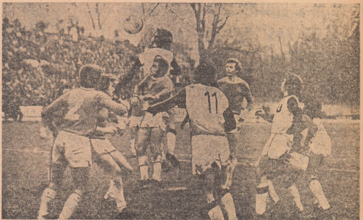
Bine grupată în defensivă, Olimpia Satu Mare va respinge un nou atac advers și va pleca cu un nou punct prețios, la sfîrșitul unui joc disputat în deplasare, cel cu „U” Cluj-Napoca

Prea puțin iubitori ai fotbalului anticipau că echipa Olimpia Satu Mare va evolua pe prima scenă a soccerului autohton la un alt de bun nivel. Este adevărat că formația din Satu Mare avusese o primăvară deosebit de fructuoasă, întrecînd la o diferență confortabilă pe ceilalți aspiranți la un loc în „A”, dar la startul sezonului de toamnă antrenorul Gh. Staicu prezentase același „11” (cu excepția extremei dreapta Lucaci, înlocuitorul lui Libra - plecat să-și satisfacă stagiul militar), afirmat în returul eșalonului secund. După primele confruntări cu celelalte divizionare A, multe dintre ele cu vechi state de serviciu în acest eșalon, s-a văzut clar că sătmărenii vor să joace