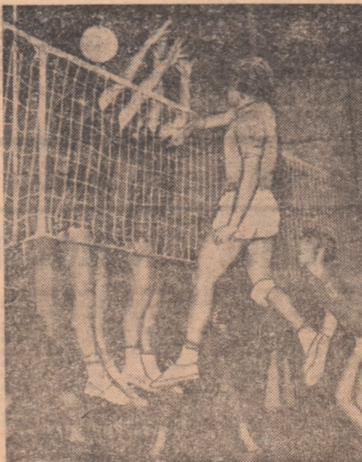
O partidă cu multe faze frumoase: C.S.U. Galați — Explorări. Cum vor juca ele la Bacău?

Ce va fi la Bacău? În primul rînd, confruntările dintre primele clasate: Explorări B. Marc — Steaua și Di-