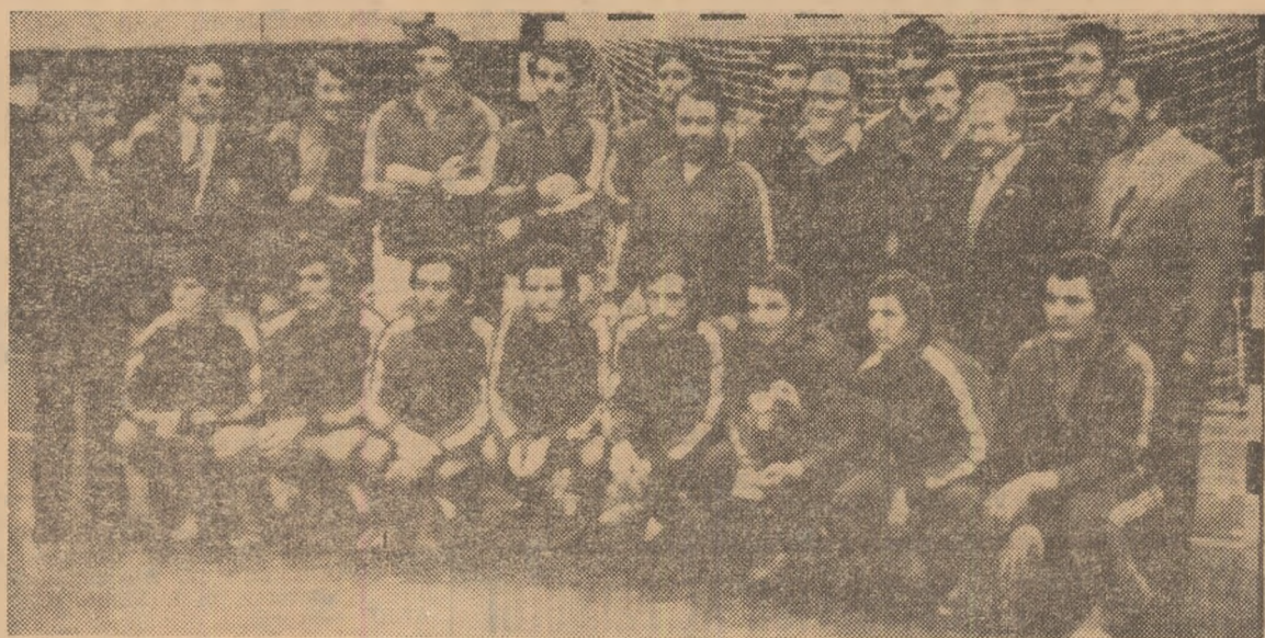
Echipa studențească a României, după victoria în cea de a VI-a ediție a C.M. universitar de handbal masculin.

O nouă performanță vine să se adauge bogatului palmares al handbalului românesc: echipa studențească a țării noastre a cucerit medaliile de aur ale celei de a VI-a ediții a campionatului mondial universitar. Aseară, în Palatul Sporturilor și Culturii, ale cărei tribune au fost neîncăpătoare pentru marea număr de iubitori ai handbalului dornici să asiste la finală, echipa României a intrat — într-o dramătică și pasionantă finală — formația Uniunii Sovietice (ca și la Lund, cu doi ani în urmă), reinnoindu-și titlul de campioană a lumii în handbalul masculin studențesc.