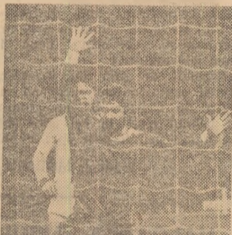
„Tunaru!” Gerd Müller mereu prezent în fazele de gol...

Și acum la firma echipei vine Detmar Cramer, Prevăzător însă, el a condiționat un contract pe termen scurt... (I. O.).