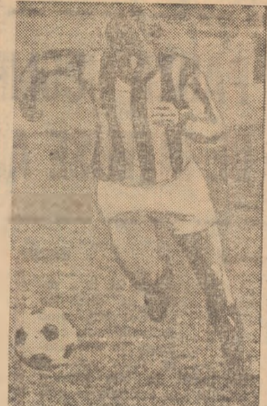
Petrovici, unul dintre jucătorii de frunte ai fotbalului iugoslav, în acțiune