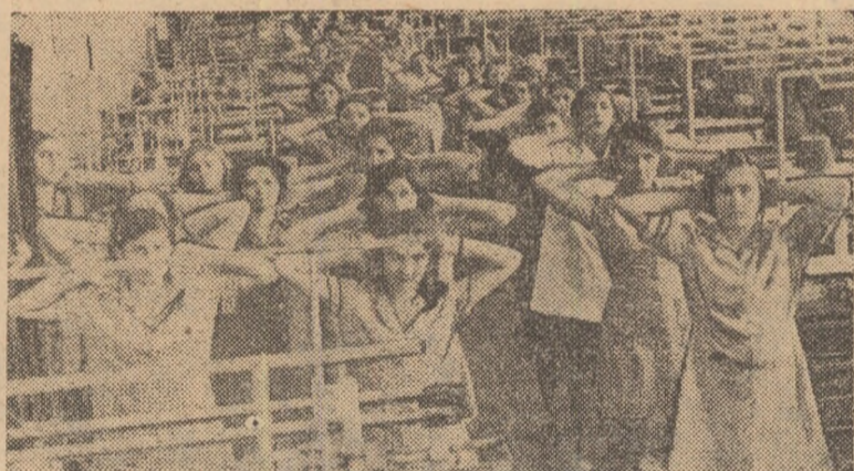
„Repriză” de gimnastică la unitatea de tricotaie din Splaiul Unirii a cooperativei bucureștene „Tricotextil”.