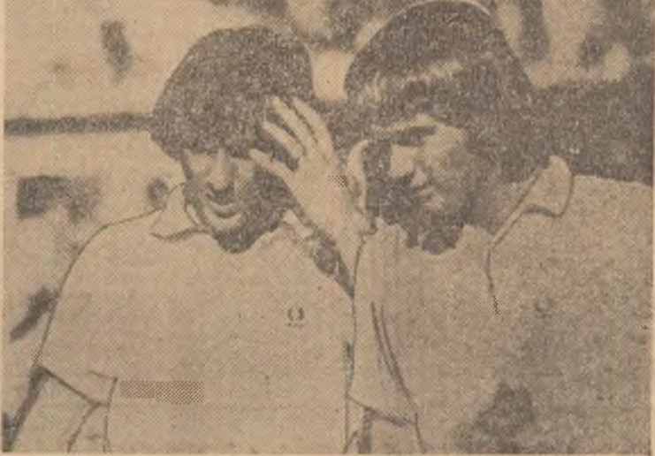
Laureații ultimelor două sezoane internaționale de tenis, Ilie Năstase și Jimmy Connors, își vor disputa oare între ei supremația, în 1975?

● Melbourne, ianuarie. Jimmy Connors anunță victoriile ce aveau să urmeze, câștigând primul „clasic” al anului, campionatul Australiei (finală cu modestul Dent: 7-6, 6-4, 4-6, 6-4). În timp ce Newcombe dispărea, undeva în sferturi de finală.