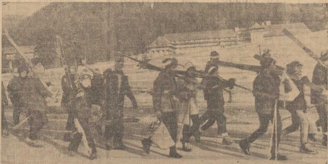
Turistii — oaspeți obișnuiți în Poiana Brașov — la o nouă întâlnire cu pirtile de schi

„O deosebită atenție se va acorda activităților sportive și turistice care se pot practica în mod organizat sau independent și au influență favorabilă asupra stării fizice și sănătății...”