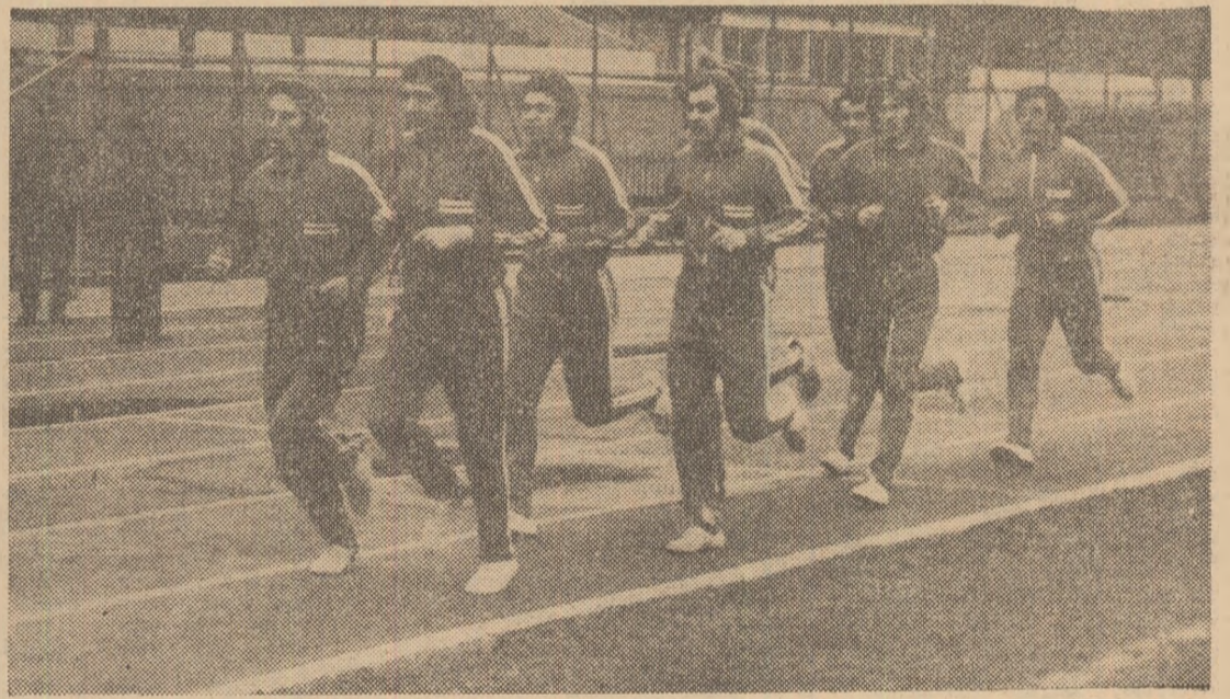
Aspect din timpul susținerii Testului Cooper de către o serie de jucători dinamoviști

metri, însă pulsul a fost și la el ridicat: 192! Dinu a alergat 3 350 avînd în final un puls de 190. Toate aceste trei cifre relevă că distanța a fost acoperită mai ales prin moral, dar cu o mare uzură a inimii. Lui Delcanu i-au lipșit cam 50 de metri pentru a trece testul. Asta nu înseamnă că el nu e un bun fotbalist. Dar ca-