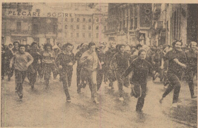
Fulgii de nea au întregit decorul sărbătoresc al întrecerii de cros...