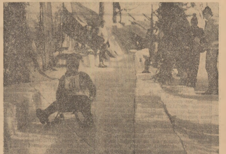
Pe o pîrție excelentă, tinerii concurenți din cadrul competiției „Săniuța de argint” au demonstrat frumoase aptitudini.