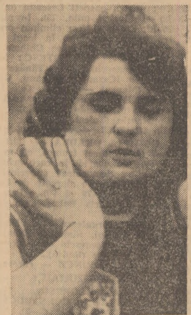
Dovedindu-și, din nou, înalta clasă, Helena Fibingeroa a câștigat detașat aruncarea greutății: 20,49 m!